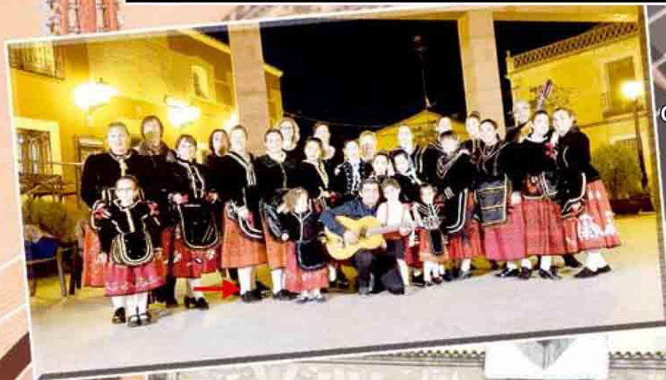
Grupo de Coros y Danzas "La Candelaria" de Gamonal