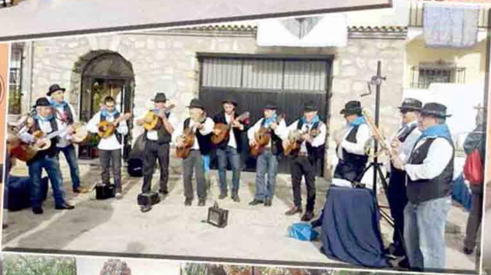
Grupo folclórico "Zambra Verata" de la comarca de la Vera

Asociación Folclórica Cultural de Talavera la Nueva