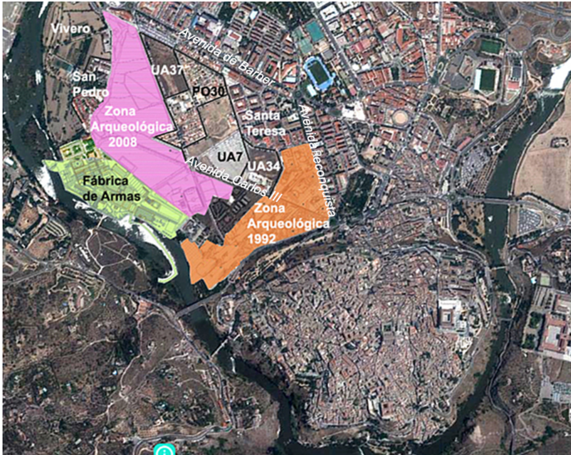
Plano de localización de Vega Baja en el contexto de la ciudad, espacios protegidos y sectores comentados en el texto (Instituto Geográfico Nacional, PNOA modificado).

y así se constata con la presencia de los actuales barrios de Santa Teresa, Avenida de Canónigos y Obrero.