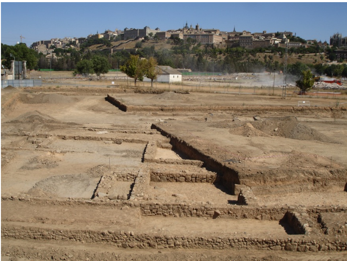
Vista general de uno de los sectores de excavación relacionado con el proyecto de urbanización de Vega Baja en el año 2006 (Parcela R12).