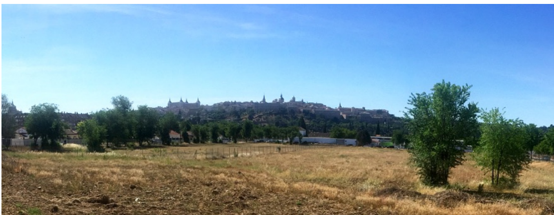
Panorámica de Toledo desde la parcela UA37

El edificio que debe contener el futuro cuartel de la Guardia Civil se pretende ubicar, según lo recogido en la prensa, en una de las parcelas dotacionales previstas en la Modificación 28 del PGOU (UA37). El problema viene dado por su localización en pleno yacimiento arqueológico de Vega Baja, aunque no incluido en su momento en los diferentes ámbitos de protección del mismo. Además, su especial localización en el extremo norte de la vega incide en el paisaje. La futura intervención debe cumplir tanto lo establecido en la Declaración de Toledo Patrimonio de la Humanidad, como con la gestión ordenada de los posibles restos arqueológicos contenidos en el subsuelo y la afección al paisaje. Por tanto, también habría que sumar el proyecto a la indefinición en materia cultural que impera en Vega Baja.