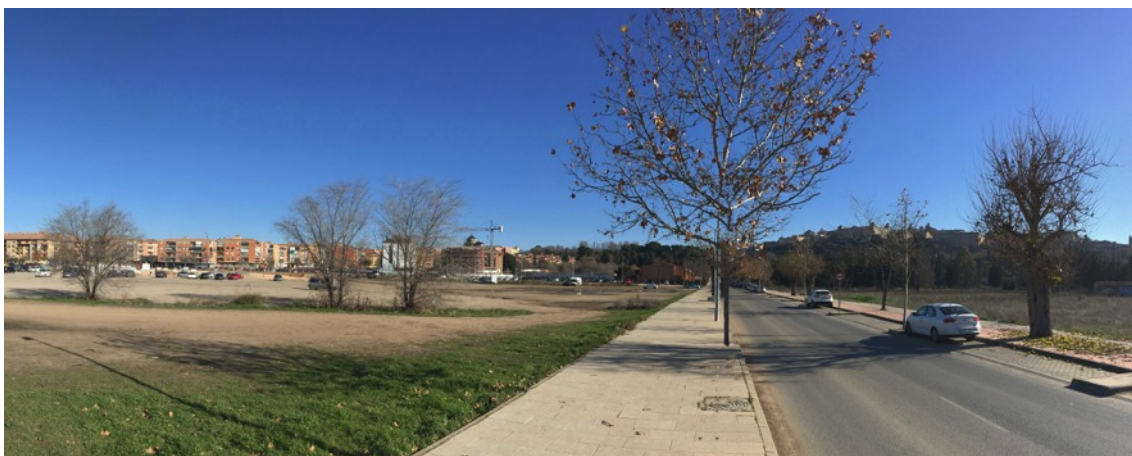
Vista general de Toledo, la ampliación de Santa Teresa y el aparcamiento disuasorio en relación con la avenida de Carlos III (dirección Oeste Este) y superficie de inundación (izquierda de la imagen).

Pese al avanzado estado de la obra, se debe repensar su diseño. La existencia de otros aparcamientos disuasorios en el entorno, da margen para trabajar en un futuro planeamiento de este espacio.