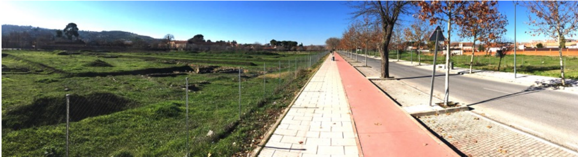
Estado actual de los restos en el sector de la avenida de Carlos III (dirección Este Oeste) que comunica con la Fábrica de Armas y San Pedro El Verde.

El proyecto urbanístico dio paso a una década sin mayores sobresaltos, combinando la resolución de indemnizaciones del proyecto inicial con discretos trabajos de consolidación y limpieza del yacimiento, junto a tímidas propuestas de gestión que nunca llegaron a término.