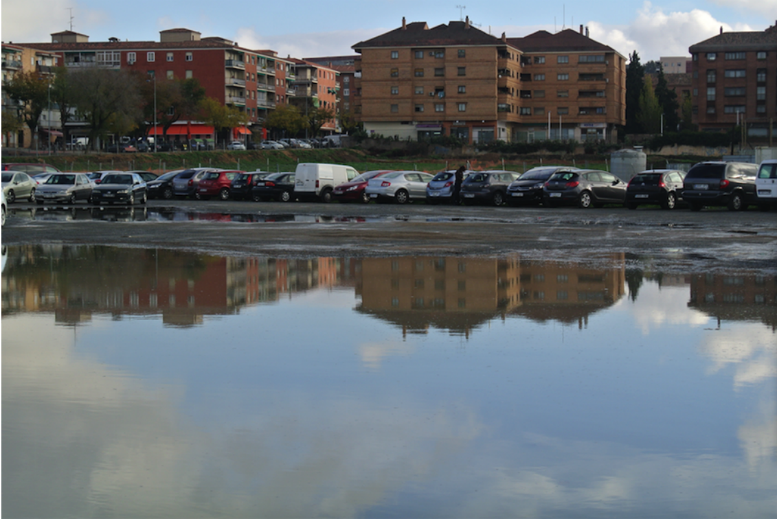
Zona de inundación en temporada de lluvia que afecta tanto a la parcela UA34 como al aparcamiento disuasorio.

ICOMOS COMITÉ NACIONAL ESPAÑOL CONSEJO INTERNACIONAL DE MONUMENTOS Y SITIOS INTERNATIONAL COUNCIL ON MONUMENTS AND SITES CONSEIL INTERNATIONAL DES MONUMENTS ET DES SITES