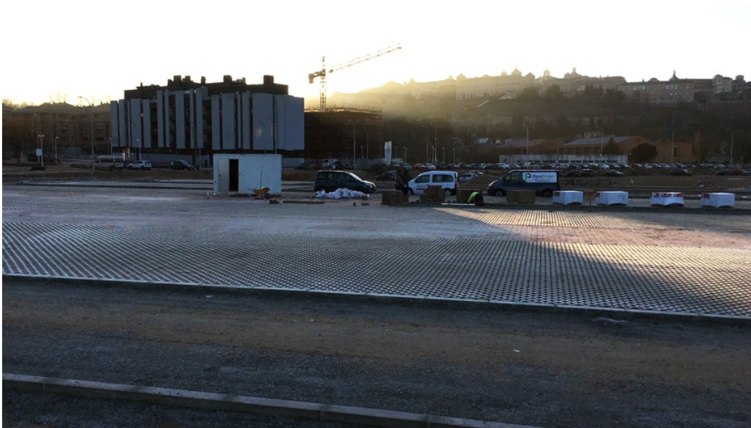
Panorámica general de aparcamiento disuasorio, ampliación de Santa Teresa y CH.

ICOMOS COMITÉ NACIONAL ESPAÑOL CONSEJO INTERNACIONAL DE MONUMENTOS Y SITIOS INTERNATIONAL COUNCIL ON MONUMENTS AND SITES CONSEIL INTERNATIONAL DES MONUMENTS ET DES SITES